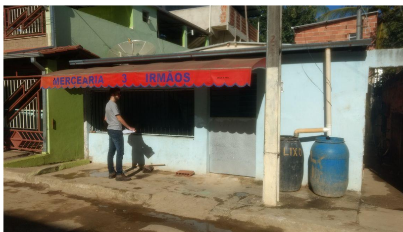
Figura 1. Registro fotográfico da visita.

No dia 03/06 realizamos contato telefônico, sem êxito nas tentativas.